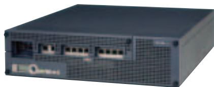
IPCOM L1400 (10ポートタイプ)