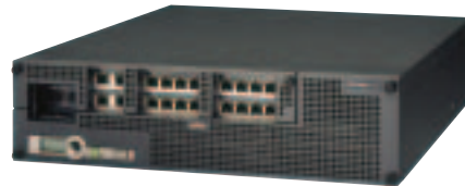
IPCOM L1400 (20ポートタイプ)